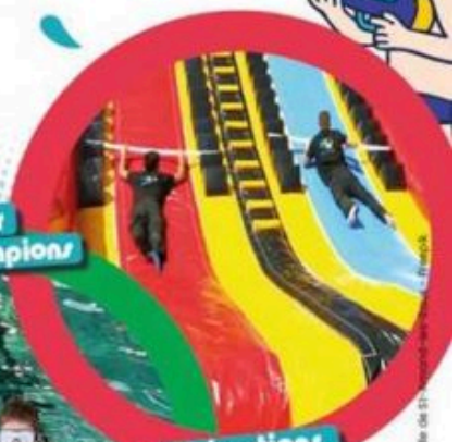
Mur des champions