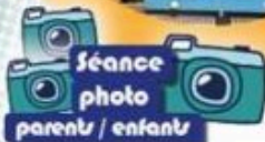
Séance photo parents / enfants