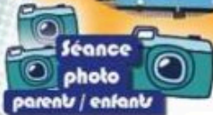
Séance photo parents / enfants