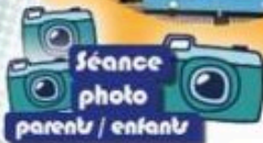
Séance photo parents / enfants