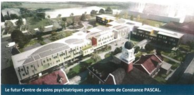
Le futur Centre de soins psychiatriques portera le nom de Constance PASCAL.

Ce futur bâtiment, érigé au coeur même de la cité hospitalière, permettra de concrétiser une volonté de rapprochement des activités psychiatriques au sein du site principal (l'hospitalisation de psychiatrie étant actuellement réalisée dans la commune de Saint-Saulve, à 10 kms de Valenciennes, dans un bâtiment datant de 1976).