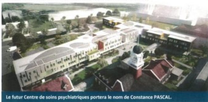
Le futur Centre de soins psychiatriques portera le nom de Constance PASCAL.

Ce futur bâtiment, érigé au coeur même de la cité hospitalière, permettra de concrétiser une volonté de rapprochement des activités psychiatriques au sein du site principal (l'hospitalisation de psychiatrie étant actuellement réalisée dans la commune de Saint-Saulve, à 10 kms de Valenciennes, dans un bâtiment datant de 1976).