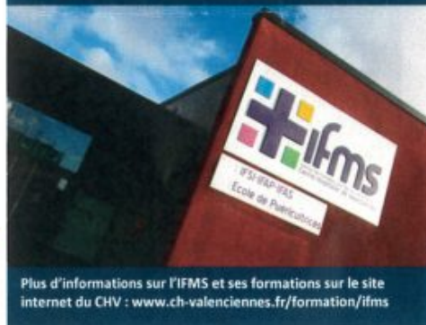
Plus d'informations sur l'IFMS et ses formations sur le site internet du CHV : www.ch-valenciennes.fr/formation/ifms

Ces formations alternent stages et enseignements théoriques afin de permettre l'obtention d'une qualification professionnelle reconnue par un diplôme, d'acquérir une expérience professionnelle afin de trouver plus facilement un emploi.