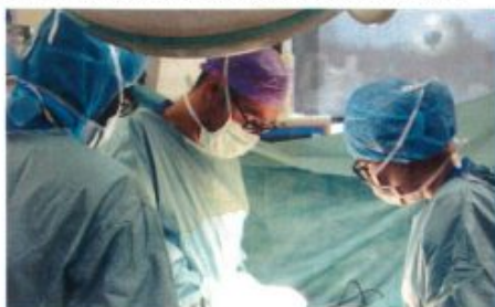
ERAS, un label international qui valide les protocoles du service de Chirurgie viscérale en faveur d'une récupération rapide du patient après son intervention chirurgicale.

Véritable démarche au service des patients, cette labellisation ERAS est la reconnaissance de la recherche continue de qualité effectuée par les équipes médicales et paramédicales du CHV.