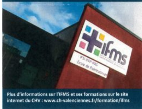
Plus d'informations sur l'IFMS et ses formations sur le site internet du CHV : www.ch-valenciennes.fr/formation/ifms

Ces formations alternent stages et enseignements théoriques afin de permettre l'obtention d'une qualification professionnelle reconnue par un diplôme, d'acquérir une expérience professionnelle afin de trouver plus facilement un emploi.