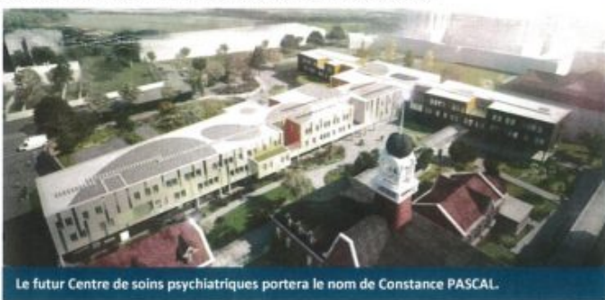
Le futur Centre de soins psychiatriques portera le nom de Constance PASCAL.

Ce futur bâtiment, érigé au coeur même de la cité hospitalière, permettra de concrétiser une volonté de rapprochement des activités psychiatriques au sein du site principal (l'hospitalisation de psychiatrie étant actuellement réalisée dans la commune de Saint-Saulve, à 10 kms de Valenciennes, dans un bâtiment datant de 1976).