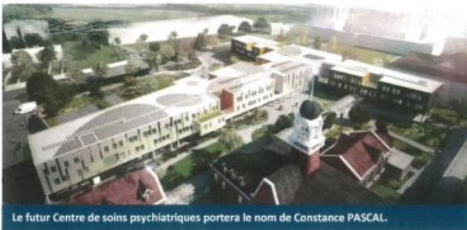
Le futur Centre de soins psychiatriques portera le nom de Constance PASCAL.

Ce futur bâtiment, érigé au coeur même de la cité hospitalière, permettra de concrétiser une volonté de rapprochement des activités psychiatriques au sein du site principal (l'hospitalisation de psychiatrie étant actuellement réalisée dans la commune de Saint-Saulve, à 10 kms de Valenciennes, dans un bâtiment datant de 1976).