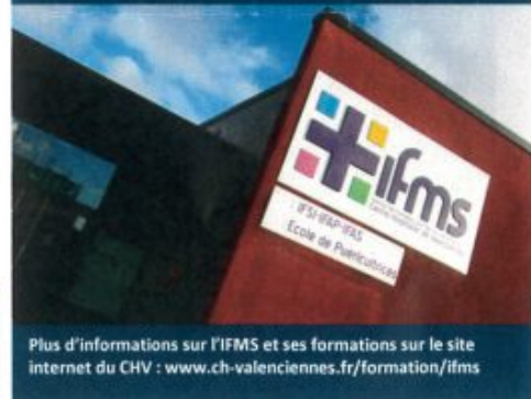
Plus d'informations sur l'IFMS et ses formations sur le site internet du CHV : www.ch-valenciennes.fr/formation/ifms

Ces formations alternent stages et enseignements théoriques afin de permettre l'obtention d'une qualification professionnelle reconnue par un diplôme, d'acquérir une expérience professionnelle afin de trouver plus facilement un emploi.