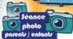
Séance photo parents / enfants