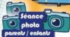
Séance photo parents / enfants