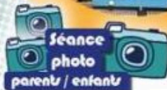
Séance photo parents / enfants