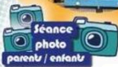
Séance photo parents / enfants