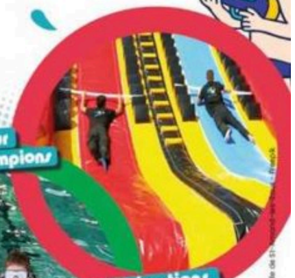
Mur des champions