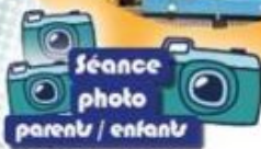
Séance photo parents / enfants