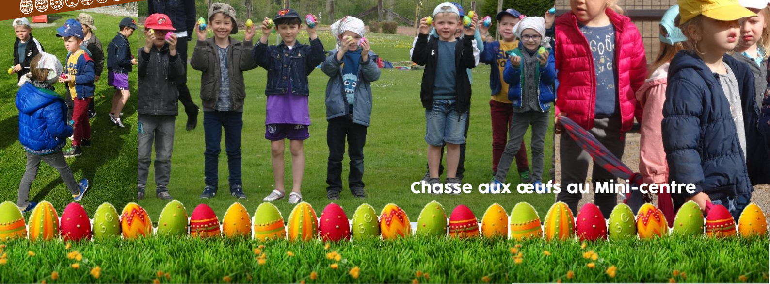
Chasse aux œufs au Mini-centre