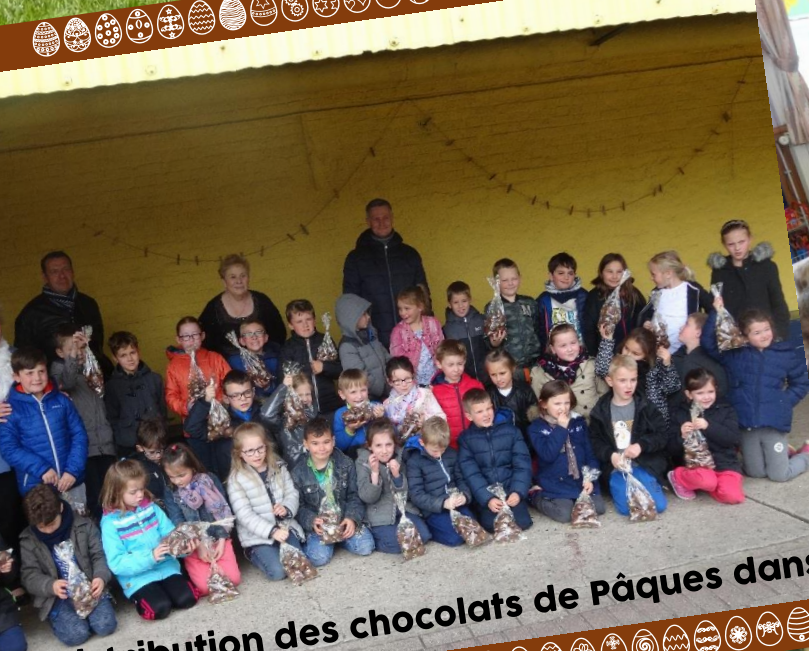
Distribution des chocolats de Pâques dans les écoles.