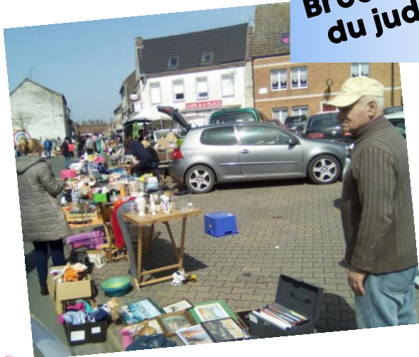
Brocante du judo